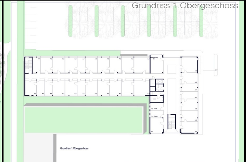
Grundriss 1. Obergeschoss