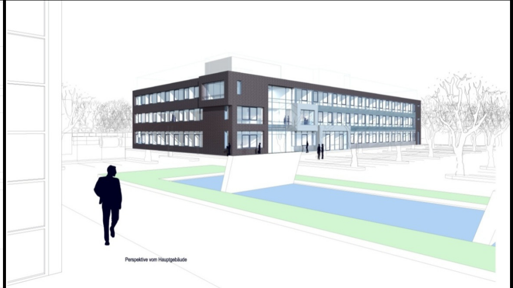
Perspektive vom Hauptgebäude